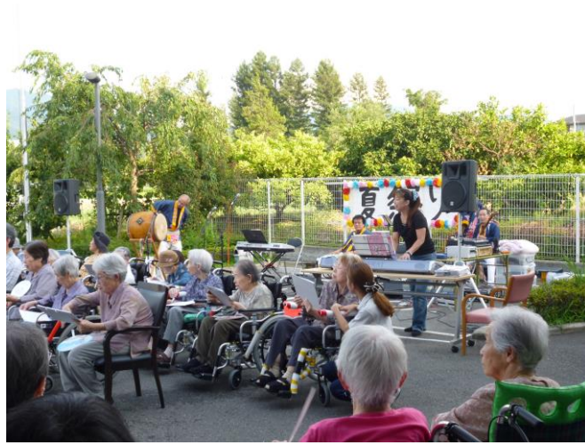
ゆりの皆さん！元気いっぱい♡♡♡