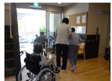
避難誘導しています！