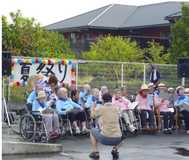
池野施設長の挨拶