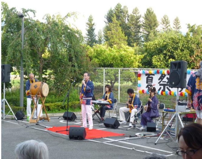
あんり 2 階・3 階の皆さん、衣装も歌も最高！