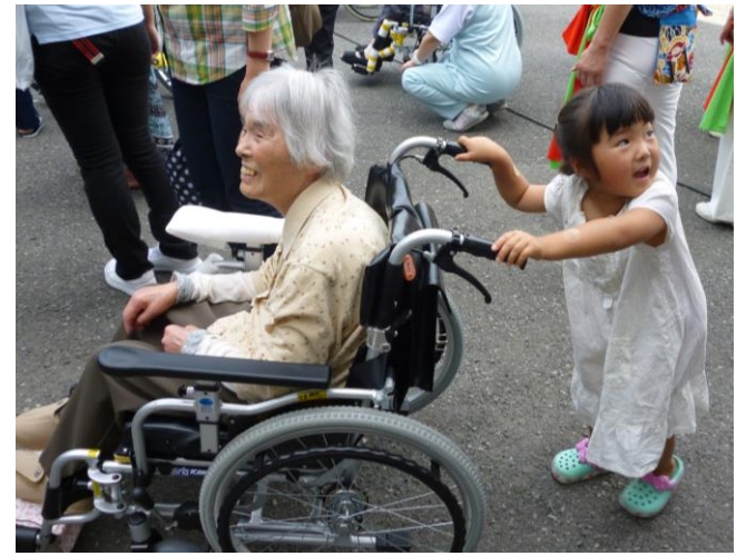
ひ孫さんと。とってもいい笑顔です！